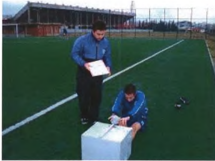
UZAN – ERİŞ TESTİ

Örneğin; 20 cm esnekliğe ulaşan bir aday en iyi dereceyi elde etmiş ise 10 tam puan alırken, 10 cm esnekliğe ulaşan aday 5 puan alır. 30 cm ve üzerine ulaşan adaylar tam puan alır.